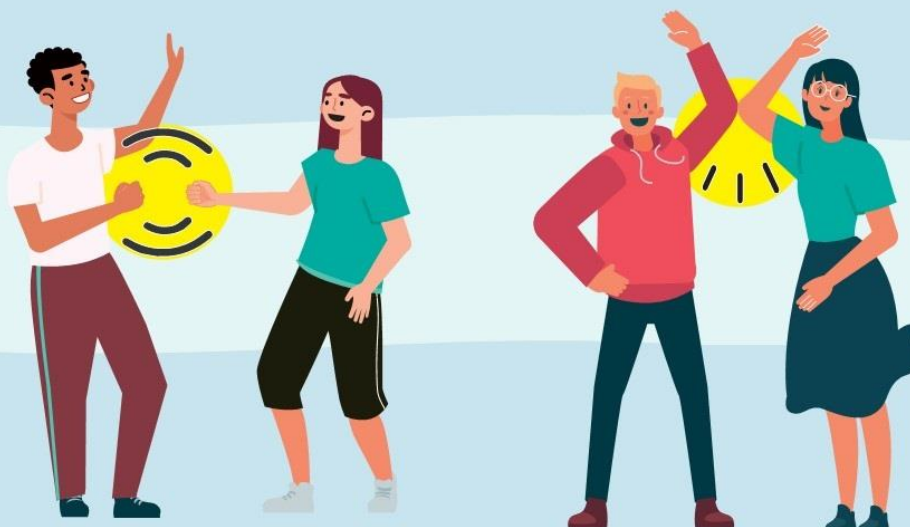
CON EL PUÑO DE LEJOS