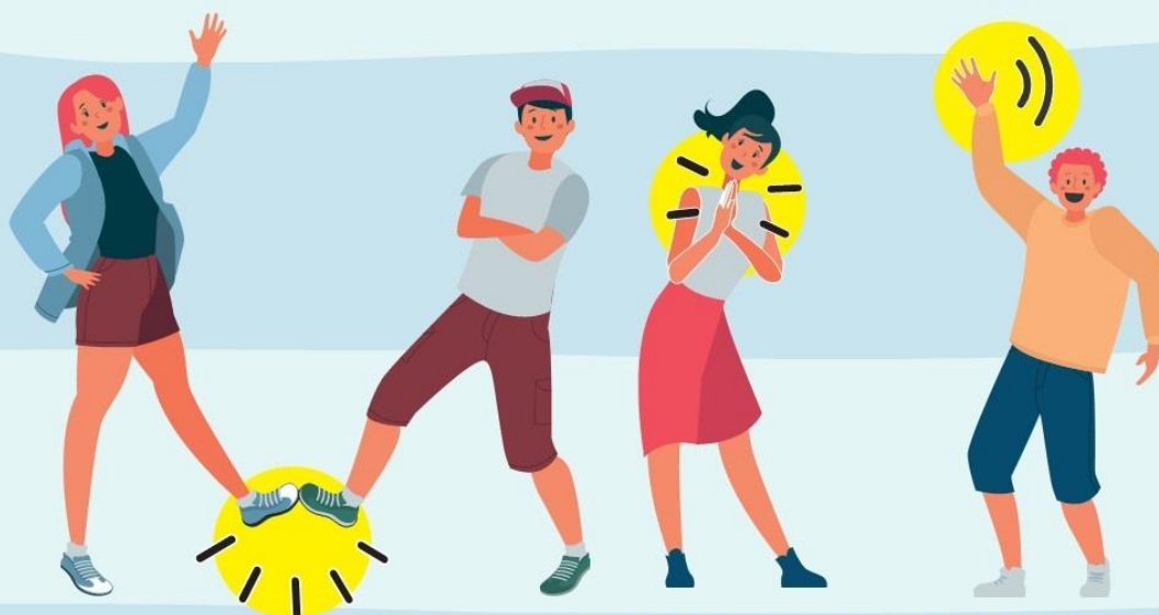
CON EL PIE